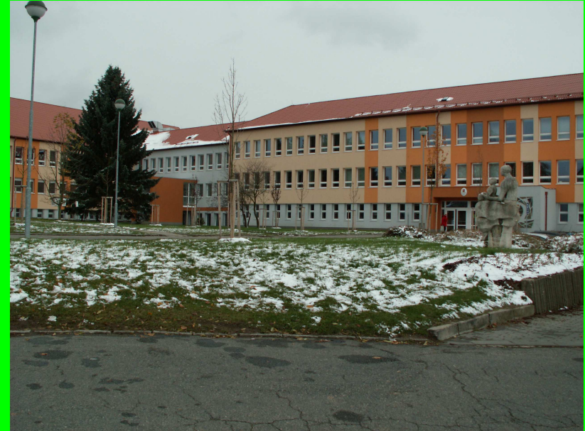
☛ po revitalizaci