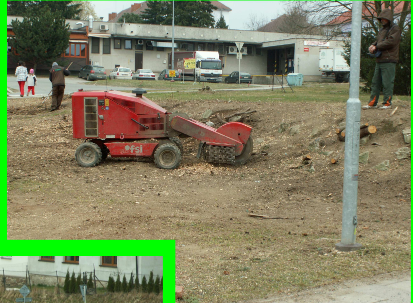
☛ likvidace pařezu