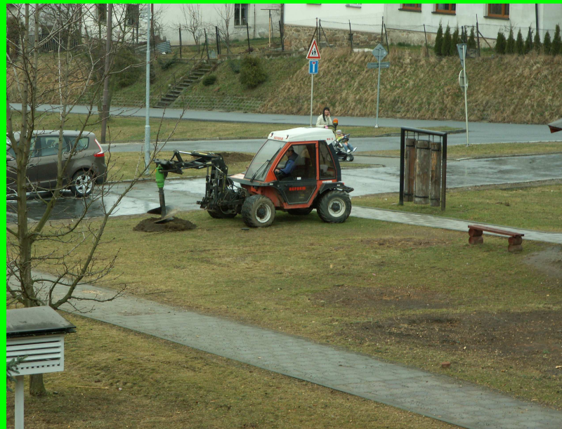
☛ příprava na výsadbu