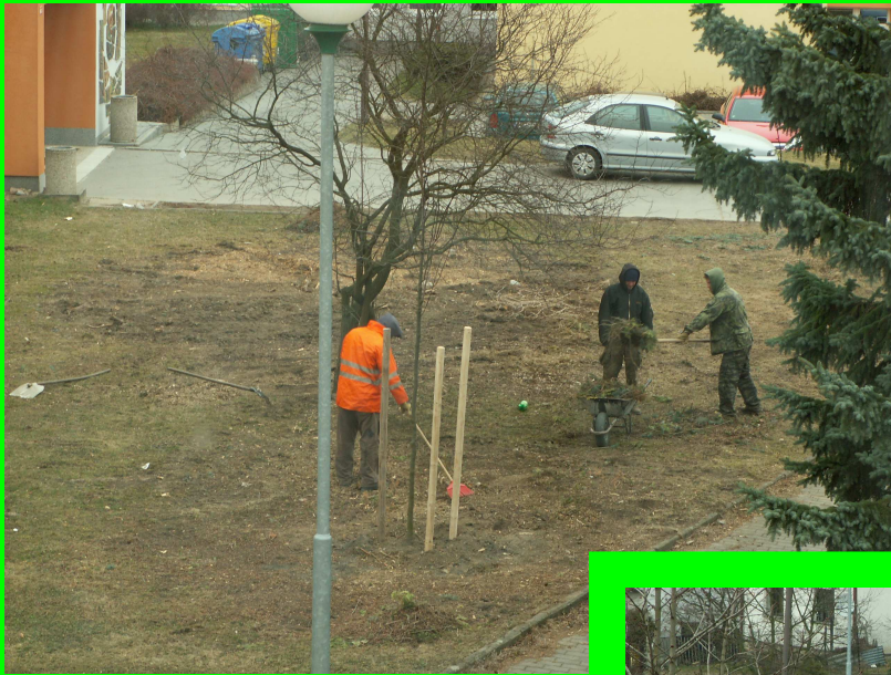
☛ úprava pozemku