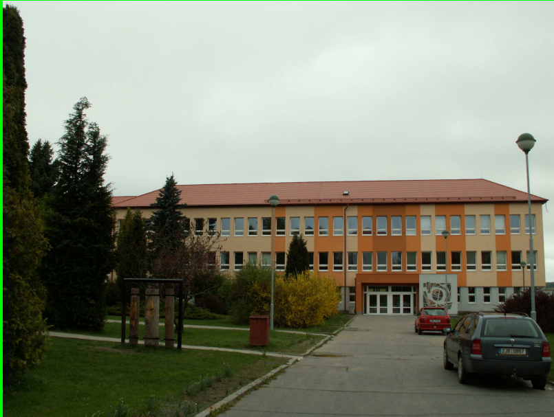
☛ před revitalizací