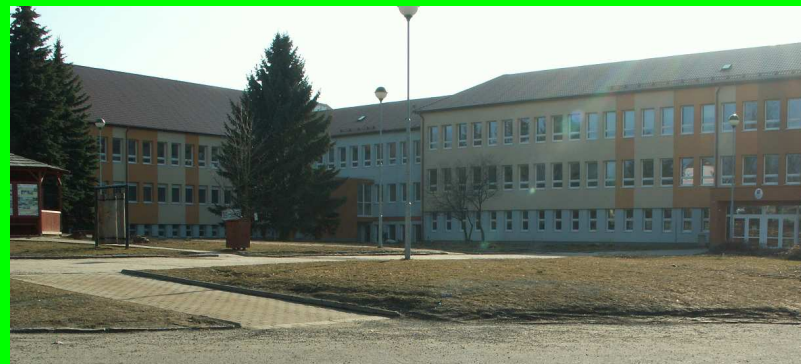
☛ po vykácení stromů a keřů